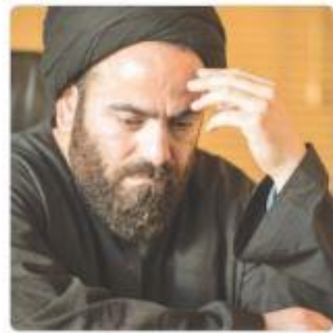
Signal History Agramatil

برخورد با ادرگراندیشان از همان ۱۰ سال بیش شروع شد زمانیکه یکتفر به تام دین به قدرت رسید و گفت مقط روایت من ( ولایت عقیه ) از دین درست است و هر کس طاقد تظر وی عمل کردیا او برخورد شد تا حکومت دینی بو سر کار است مصالب این ملت و کشور ادامه خواهد داشت و تنها راه الستولار پسم است.